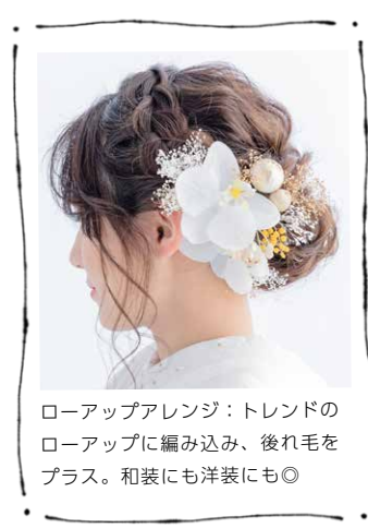
ローアップアレンジ：トレンドの ローアップに編み込み、後れ毛を プラス。和装にも洋装にも◎