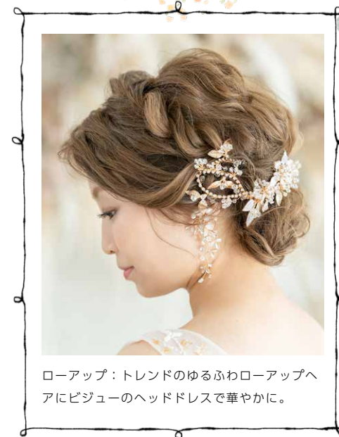
ローアップ：トレンドのゆるふわローアップヘ アにビジュアのヘッドドレスで華やかに。