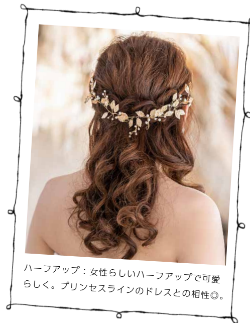
ハーフアップ：女性らしいハーフアップで可愛 らしく。プリンセスラインのドレスとの相性◎。