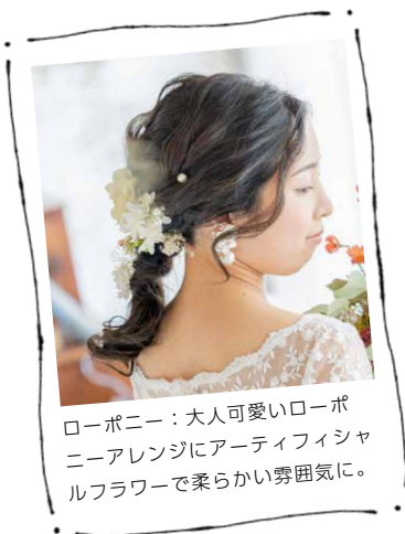
ローポニー：大人可愛いローポ ニーアレンジにアーティフィシヤ ルフラワーで柔らかい雰囲気に。