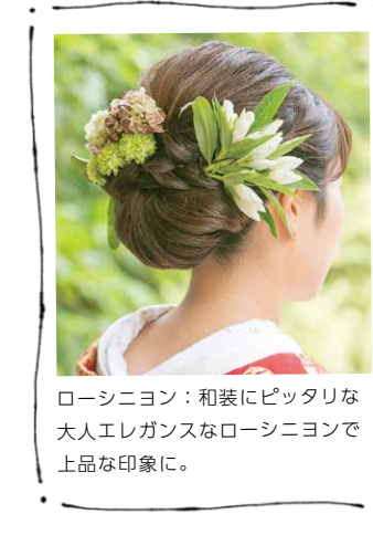
ローシニヨン：和装にピッタリな 大人エレガンスなローシニヨンで 上品な印象に。