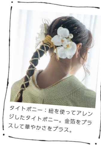
タイトポニー：紐を使ってアレ ンジしたタイトポニー。金箔をプ ラスして華やかさをプラス。