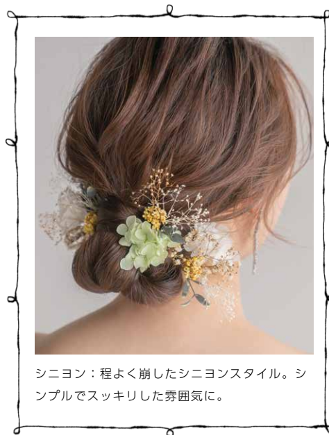
シニヨン：程よく崩したシニヨンスタイル。シ ンプルでスッキリした雰囲気。

ヘアメイクもわがままに！ ウェディングの経験豊富なヘアメイクのプロが あなたの「キレイ」を最大限に引き出します。 じっくりカウンセリングしながら花嫁のなりた いを叶えます。